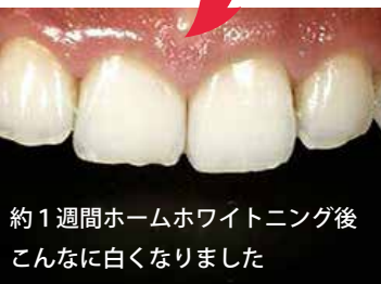
約1週間ホームホワイトニング後 こんなに白くなりました

加齢により表面のエナメル質も中の象牙質も黄ばみが強くなる 上に、肌同様うるおいがなくなり透明度が落ちてきます。 ぜひお得なキャンペーンのチャンスに、気軽に歯を白くして みませんか？きっと「やって良かった！」と感じて頂けるはず