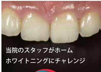
当院のスタッフがホーム ホワイトニングにチャレンジ

ホームホワイトニングは、ご自宅で「本を読みながら」 「テレビを見ながら」「就寝時」など好きな時間に出来るのが メリットです！毎日やって頂くとより白さの変化がわかります。